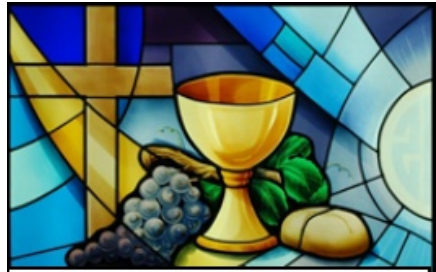
Viering voor Jong en Oud

In de adventsperiode werd er elke week in de kinderwoorddienst verder gebouwd aan de kijktafel. Iedere adventszondag kregen de