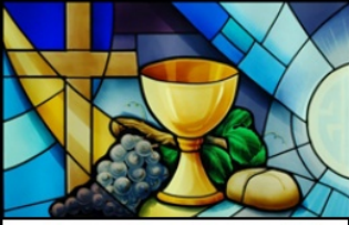
Viering voor Jong en Oud

Op zondag 5 april zal er in Brielle om 9:30 uur een viering zijn voor Jong en Oud.