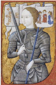
H. Jeanne d'Arc (feest 30 mei)

deel van de R.K. Parochie Nicolaas Pieck en gezellen